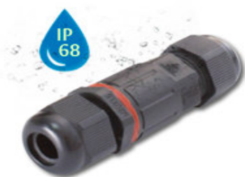
NZ 10 L 7,5 cm