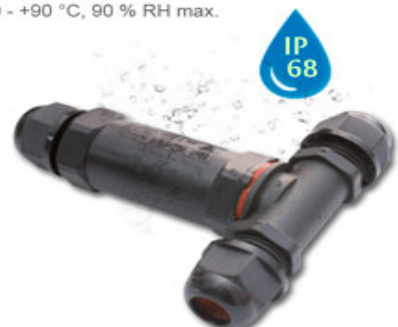
NZ 12 L T-Stück