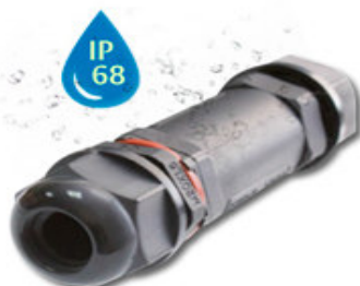
NZ 11 L 10 cm